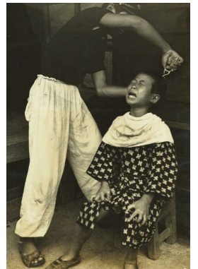
143 散髪 八代市河原町(現松崎町) 昭和27年(1952)3月2日