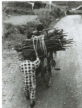
147 薪運び 球磨郡相良村四浦 昭和26年(1951)