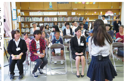
▲バトラーのプレゼンテーションを聞く参加者たち

最終的に、観客らに「どの本が読みたくなったか」を観点に、その日の「チャンプ本」を挙手で選定してもらった。 この日のチ