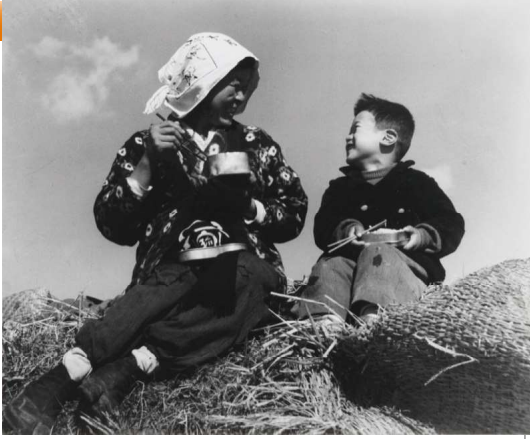
63 お屋どき 八代市坂本町 昭和23年(1948)3月5日

野良仕事での母と子。球磨川の土手で分厚い弁当箱にぎっしり詰まったご飯を仲良く食べている。貧しいけれど、お母さんと一緒にの幸せ、子供とともに笑う母の幸せ。