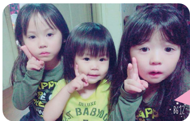
元気な女の子3人組!