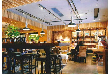
▲リバレインの中にあるしゃれた喫茶