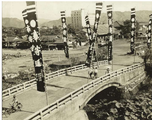
14 八代宮神橋 八代市松江町 昭和41年(1966)10月18日

八代城址から眺めるお堀には蓮の葉が浮かび、参道の向こうには大書院、太洋デパートがあって、当時をしのばせる。