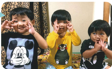
やんちゃんる3人組! ママが大好き