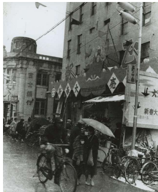
15 新春の太洋デパート八代店 八代市本町2丁目 昭和38年(1963)1月