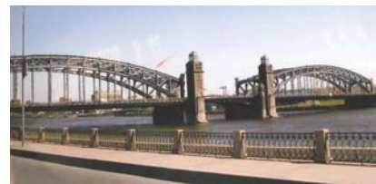
▲町を流る川に上下する橋が…

レも少なく、一方通行になっており、年に何回か迷子になる人が出るので、すから気をつけて。