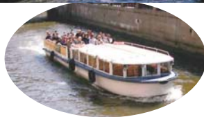
運河を走る遊覧船

15分ぐらいの所に、大王の執務室と豪邸がそのまま保存されており、建物の前には何千坪あるかわからないほど広い庭園があり、大都会にいたとは思えないほど静かなスペースで、季節の花々、野鳥が飛び交い、何百年