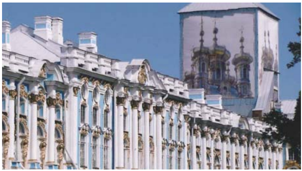
▲エルミタージュ美術館