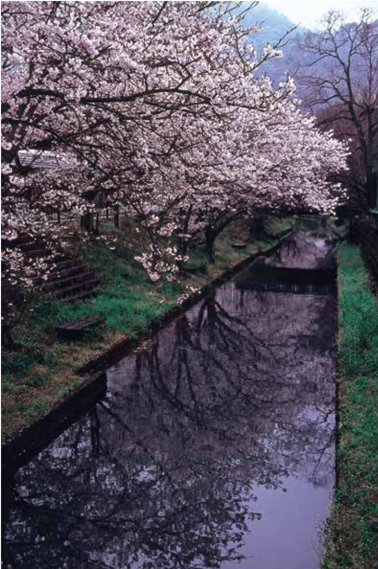
〈写真〉山園 重信 (撮影場所:宮地町)