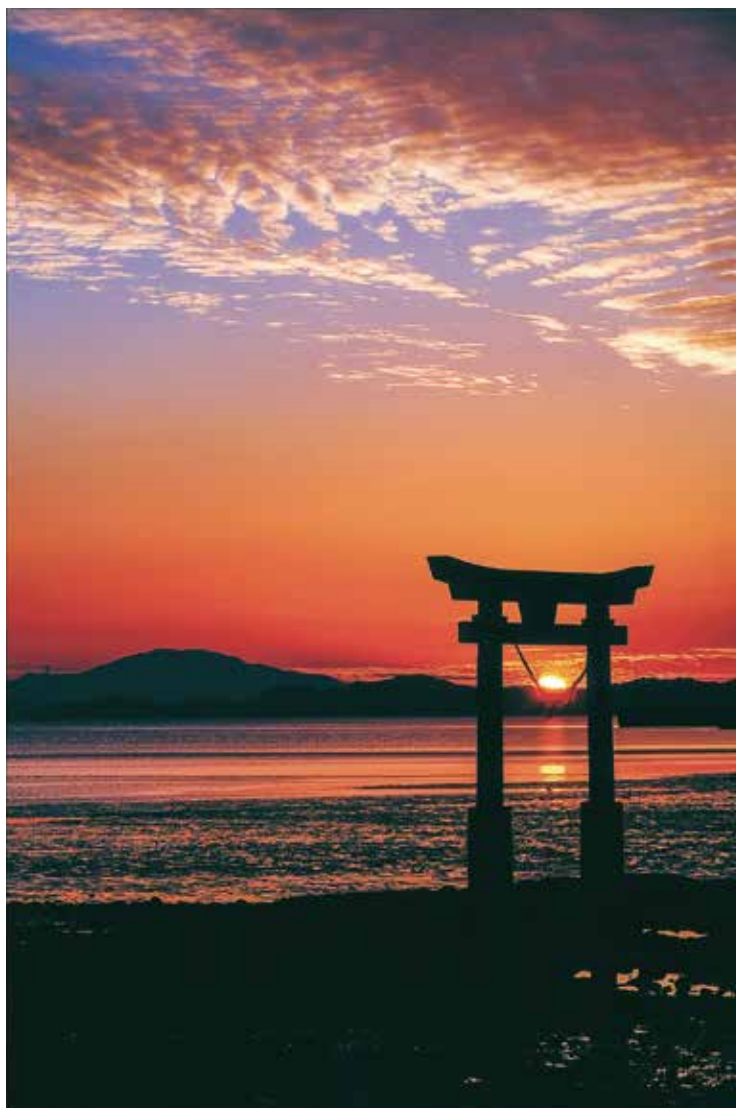
(撮影場所: 永尾劔神社 (宇城市不知火町))