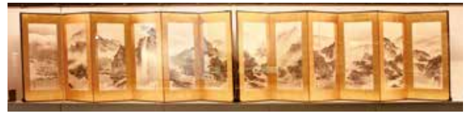
▲球磨川図屏風(球磨川の名勝12カ所を書いた山水図)