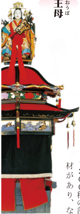
西王母 せいおうぼ

ユネスコ無形文化遺産の主対象である笠鉾は、旧城下町から9基出され、それらの基本的な構成はほぼ同じですが、屋根の形や装飾を見比べてみると、同じものは一つもありません。また、妙見祭の様々な出し物の中で初期の姿から大きく変化したのは笠鉾です。それは、町の人たちが他の町より目新しいものを豪華なものをと長い年月をかけて笠鉾に心血を注いできたことを物語っています。今回開催される「笠鉾大解剖シリーズ」としてこれまで笠鉾菊慈童と笠