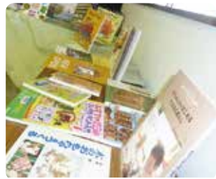
木のおもちゃはシンプルなので、いろんな遊び方ができ、子どもたち

木のおもちゃのいいところは、まず五感で楽しめることです。木の心地良い手触りと音、自然の香り、目にも優しく、心と体を育むのにとっても良いです。また、使っていくと手に馴染んでいくところ、傷さえ味わいとなつて長く使えるところも木のおもちゃならではです。