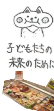
子どもたちの未来のために

食品ロスをなくすキマラワターを紹介し、名前は「ロスノン」持ちょうは、ロムセがノンです。