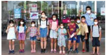
最後に、モグモグチャレンジを紹介し、賞味期限・消費期限のせま、た、値下げ前商品や値下げ商品で、「もぐにい」シリーズを10枚集めると果品が当たるがチャージ分と交わることができる。