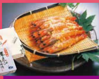
車えびの味噌漬け