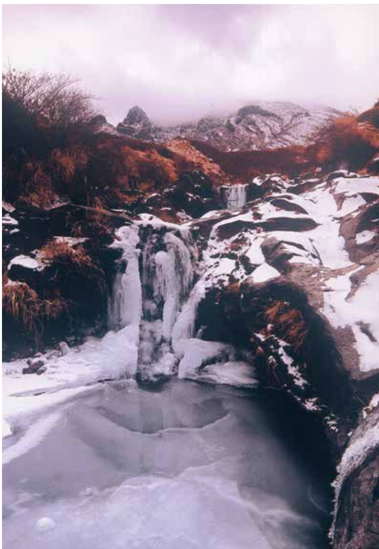
(撮影場所:阿蘇の仙酔峡 せんすいきょう )